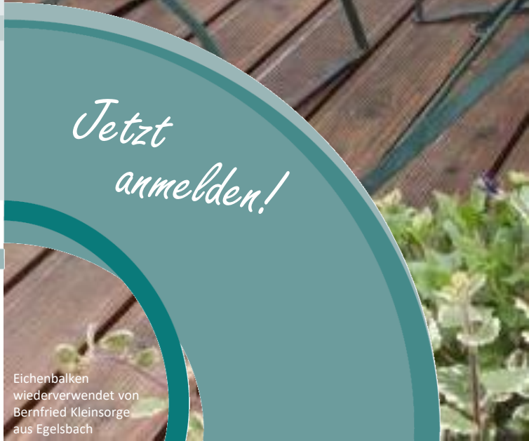
Eichenbalken wiederverwendet von Bernfried Kleinsorge aus Egelsbach

WIEDERVERWENDEN STATT VERSCHWENDEN 1. Konferenz zur innovativen Wiederverwendung von Baumaterialien am 08. September 2022 in Münster (Hessen)