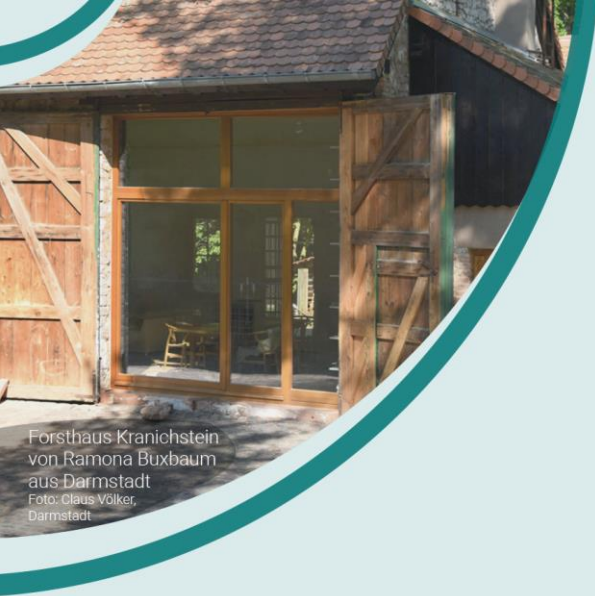
Forsthaus Kranichstein von Ramona Buxbaum aus Darmstadt

Liebe Kongressgäste, der Bausektor zählt zu einem der ressourcenintensivsten Wirtschaftssektoren überhaupt. Vor allem in den stark wachsenden Städten und Ballungsräumen werden enorme Mengen an Baumaterialien benötigt. Gleichzeitig ist die Bauwirtschaft für ca. 55 % des gesamten deutschen Abfallaufkommens verantwortlich. Weltweit gehen ca. 11 % aller CO 2 -Emissionen auf den Bausektor zurück.